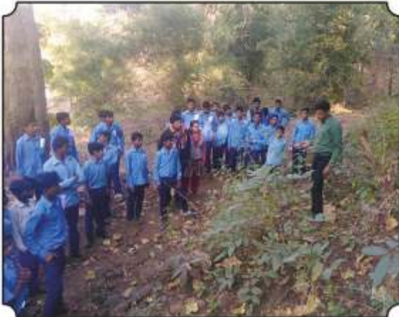
निसर्ग पाऊलवाटेने जातांना वनरपती तसेच कोळीचे जाळे दाखवितांना