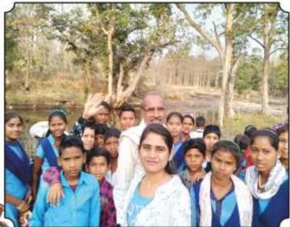
नदीवरील पक्षी दाखविले असतांना घेतलेले छायाचित्र