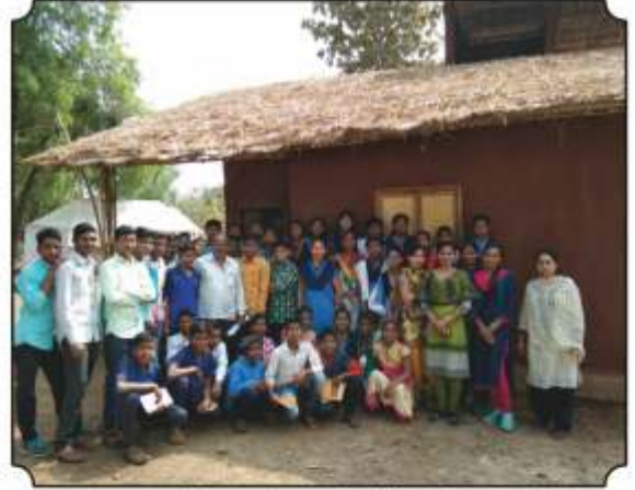
सर्व विद्यार्थ्यांसमवेत घेतलेले छायाचित्र