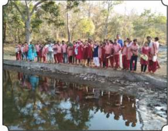
नैसर्गिक पाणवठ्यावर थांबुन आढळणारे पक्षांची ओळख करून देण्यात आली