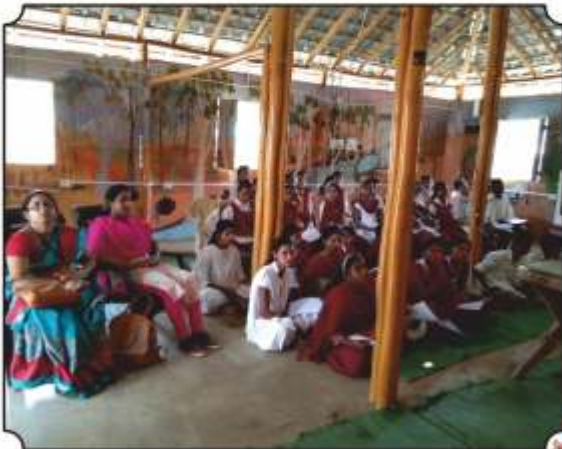
कार्यक्रमांमध्ये उपस्थित विद्यार्थी