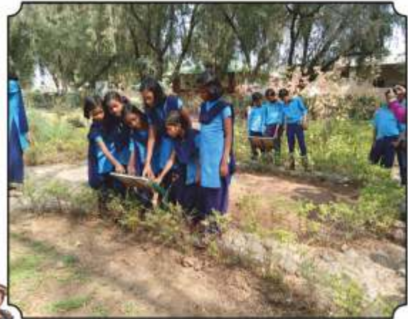
बॉटनिकल गार्डनमध्ये विविध औषधी वनस्पतीची निरखुन पाहतांना विद्यार्थी