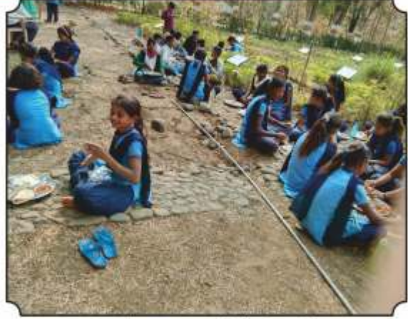
वनभोजनाचा आस्वाद घेतांना विद्यार्थी