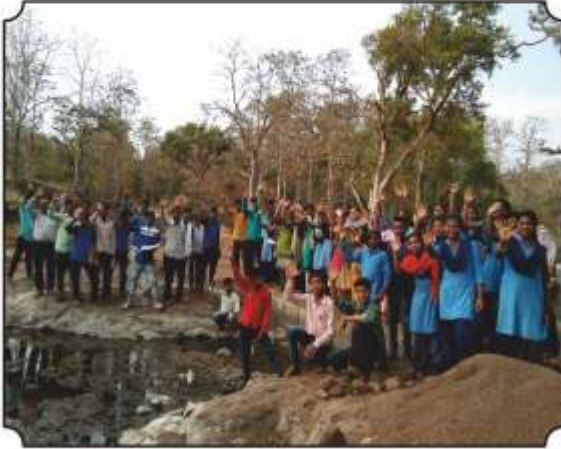
निसर्ग भ्रमंतीमध्ये नैसर्गिक पाणवठ्यावर घेतलेले छायाचित्र