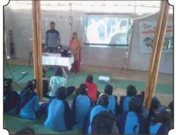
विद्यार्थ्यांना मेळघाटातील व्हिडिओ दाखवित असतांना