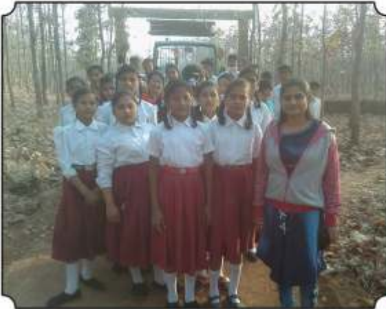
कावळाझरी गेट, हरिसाल येथुन निसर्ग पाऊलवाटेने जात असतांना