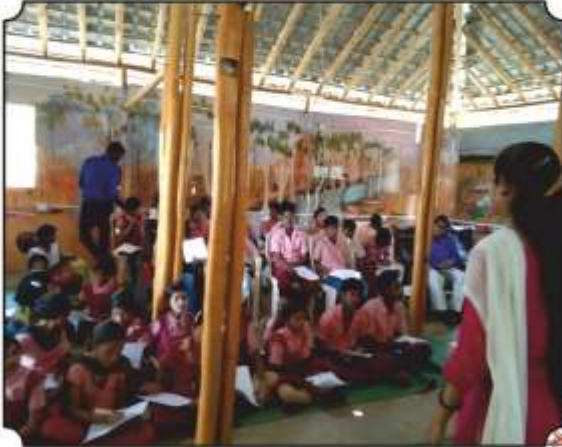
बाघाच्या अधिवासाचे महत्व पटवुन देतांना