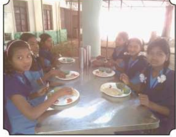
दुपारच्या जेवणाचा आस्वाद घेतांना विद्यार्थी