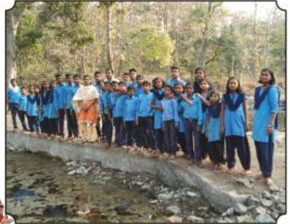
नैसर्गिक पाणवठ्यावरील विविध पक्षी दाखविल्यानंतर घेतलेले छायाचित्र