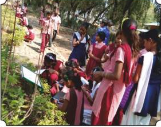
बॉटनिकल गार्डनमधील औषधी वनस्पतींची माहिती जाणून घेतांना विद्यार्थी