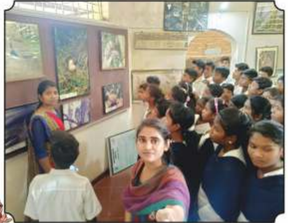
निसर्ग निर्वचन सेंटरमध्ये विद्यार्थ्यांना विविध पोस्टर्स दाखविण्यात आले