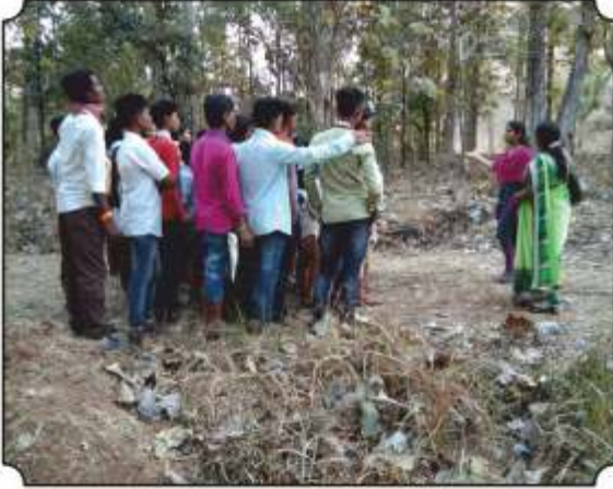
कॅमेरा ट्रॅप दाखवितांना व माहिती देतांना