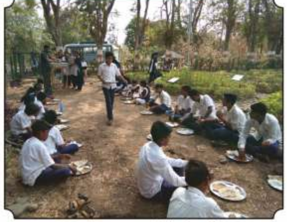
वनभोजनाचा आस्वाद घेतांना विद्यार्थी