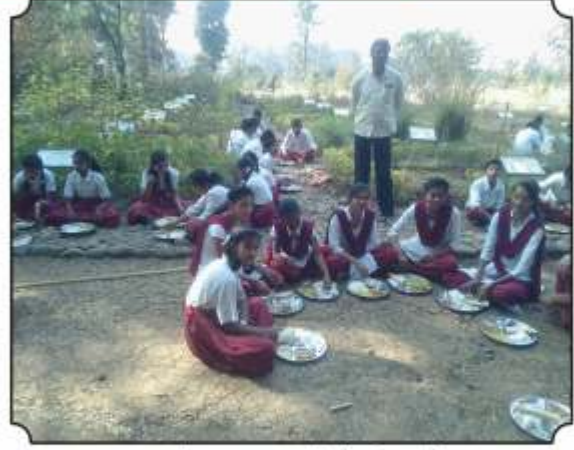
वनभोजनाचा आस्वाद घेतांना विद्यार्थी