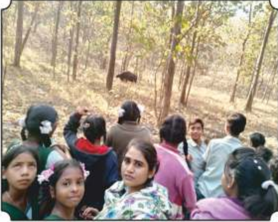
जंगलामध्ये रानगवा दिसल्यावरचा एक क्षण