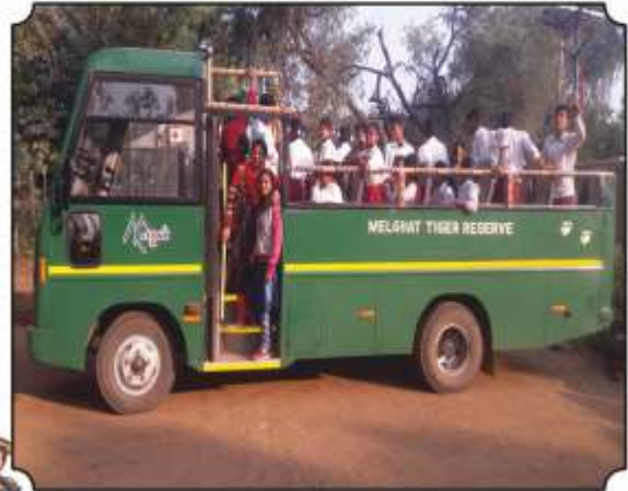
जंगल सफारीला निघतांनाचे छायाचित्र