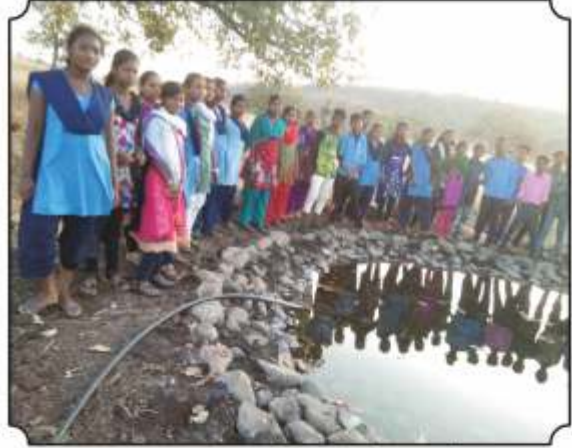
कृत्रिम पाणवठ्यावर विद्यार्थ्यांना नेण्यात आले