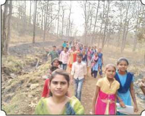
निसर्ग पाऊलवाटेने विद्यार्थ्यांना घेवून जातांना