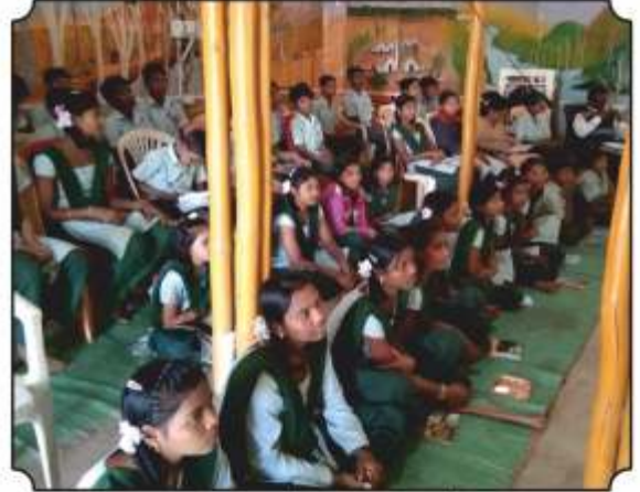
कार्यक्रमांमध्ये उपस्थित विद्यार्थी