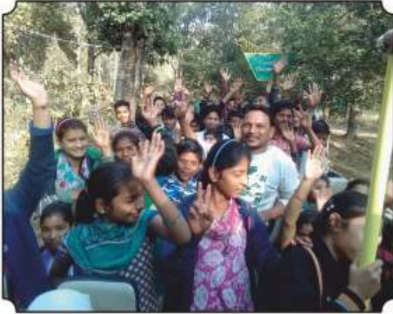
प्राणी दिसल्यावर उत्साहित झालेले विद्यार्थी