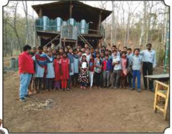
वनसंरक्षक कुटीवर घेतलेले छायाचित्र