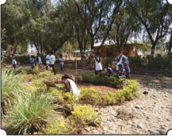
औषधी वनस्पतीची माहिती घेतांना विद्यार्थी