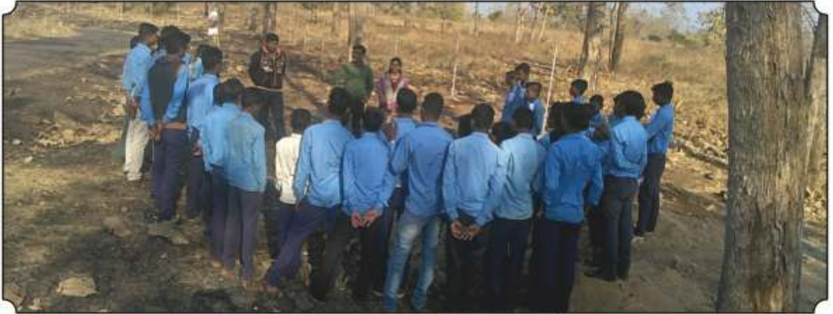
निसर्ग भ्रमंतीमध्ये प्राण्यांच्या पाऊलखुणा, जंगलाबद्दल माहिती देतांना