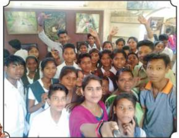
निसर्ग निर्वचन सेंटरमध्ये पोस्टरस दाखविल्यानंतर घेतलेला एक क्षण