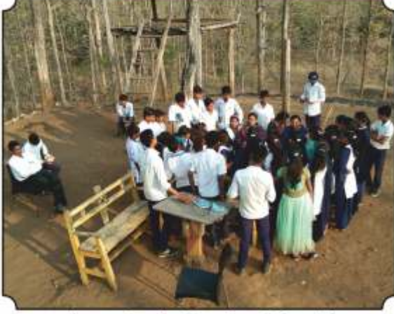
वनसंरक्षण कुटीबर थांबुन विद्यार्थांच्या प्रतिक्रिया घेतांना