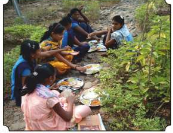
वनभोजनाचा आस्वाद घेतांना विद्यार्थी व विद्यार्थिनी