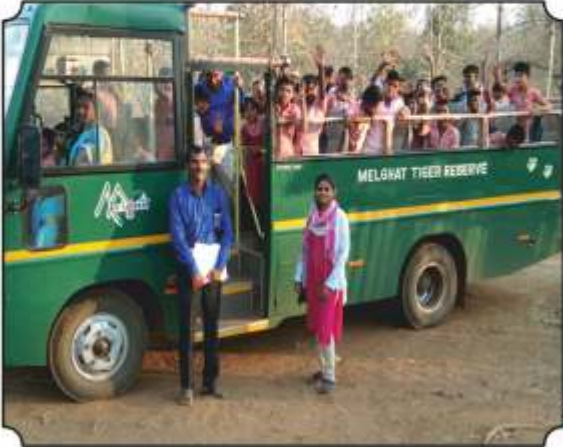
जंगल सफारी बसमधुन जातांना एक क्षण