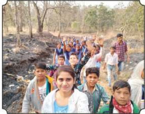
विद्यार्थ्यांना निसर्ग पाऊलवाटेने घेवुन जातांना