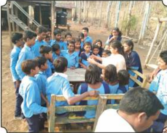
वनसंरक्षण कुटीवर धांकुन विद्यार्थ्यांना प्राण्यांचे अधिवासाबद्दल महत्व समजुन देतांना