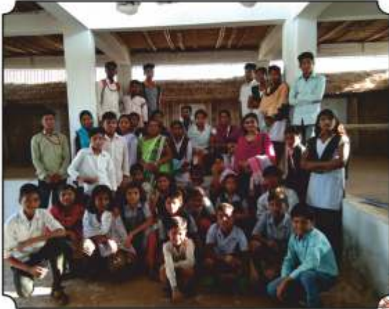
बांबू केंद्रावर जावुन विविध वस्तु दाखविल्यावर घेतलेला क्षण