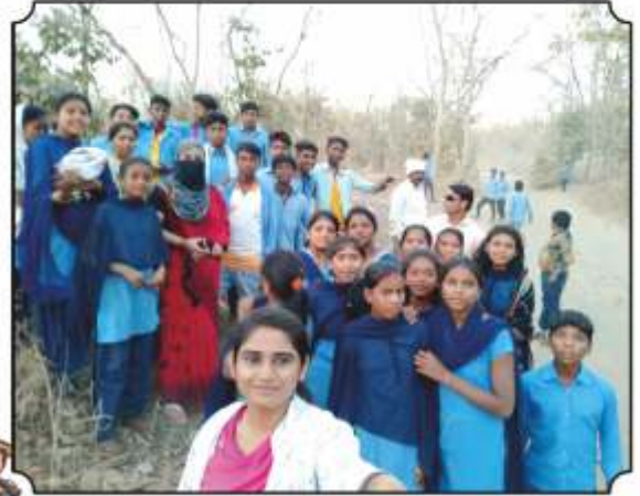
कॅमेरा ट्रॅप व त्याची माहिती दिल्यानंतर