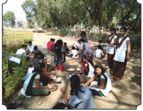
वनभोजनाचा आस्वाद घेतांना विद्यार्थी