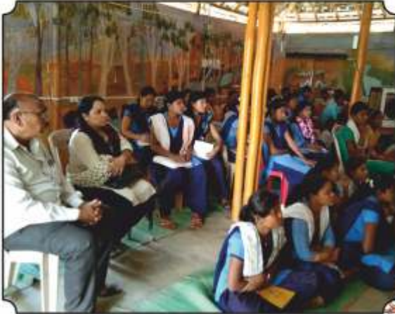
कार्यक्रमामध्ये उपस्थित विद्यार्थी