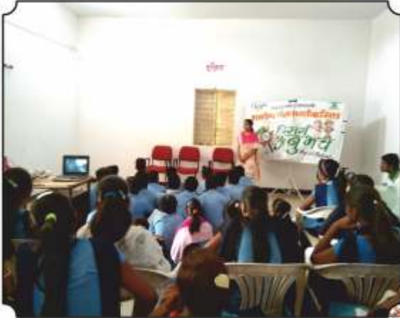
कार्यक्रमांमध्ये उपस्थित विद्यार्थी