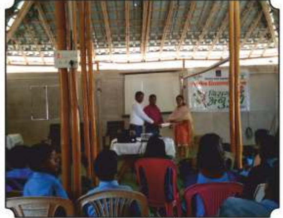
शाळेला पुस्तकांची भेट देतांना