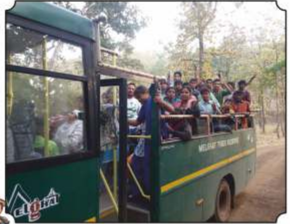
जंगल सफारीला जातांना विद्यार्थी