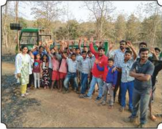
निसर्ग भ्रमंतीला निघाले असतांना घेतलेले छायाचित्र