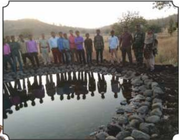
कृत्रिम पाणवठ्यांवर लावलेला कॅमेरा ट्रॅप दाखवुन महत्वपूर्ण माहिती देण्यात आली