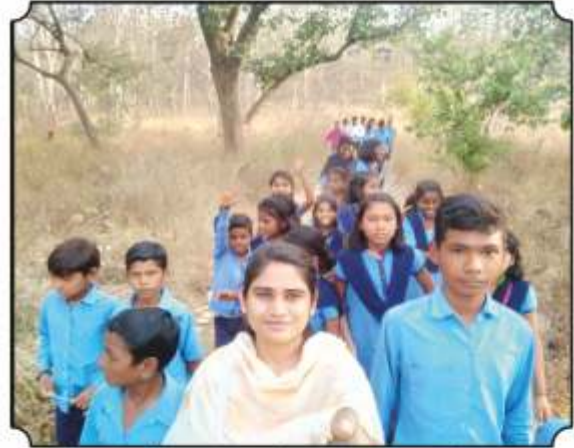
निसर्ग पाऊलवाटेने जातांना प्राण्यांच्या पाऊलखुला दाखविण्यात आल्या