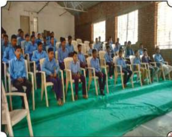
कार्यक्रामध्ये उपस्थित विद्यार्थी शासकीय आश्रम शाळा, रायपूर