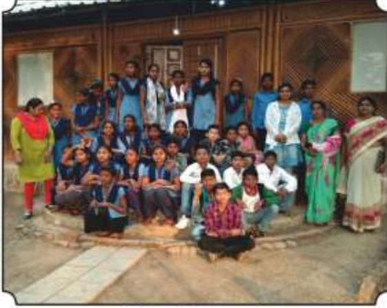
सर्व विद्यार्थ्यांसमवेत छायाचित्र