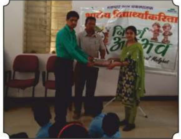
शाळेला पुस्तकांची भेट देतांना