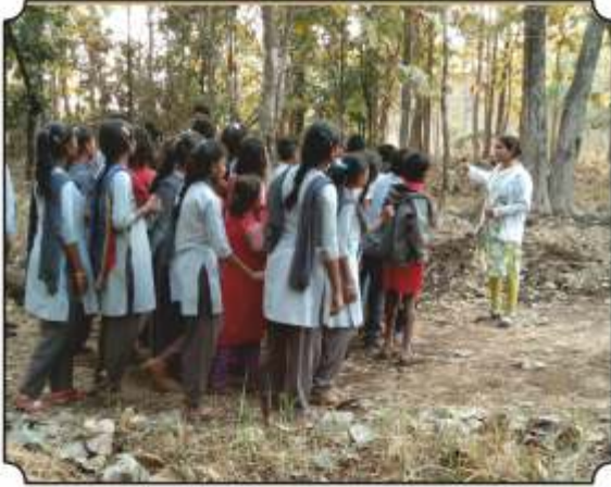
कॅमेरा ट्रॅप दाखवून त्याबद्दल माहिती सांगतांना