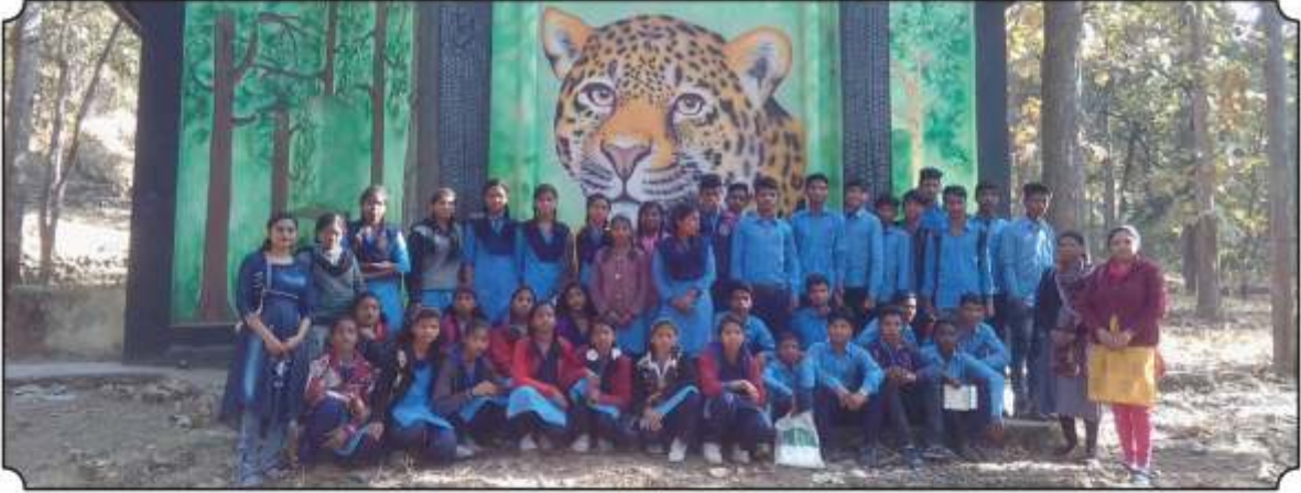
विद्यार्थ्यां समवेत छायाचित्र