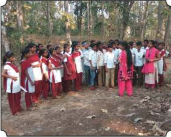
कॅमेरा ट्रॅप दाखवुन त्याबद्दल महत्वपूर्ण माहिती देतांना