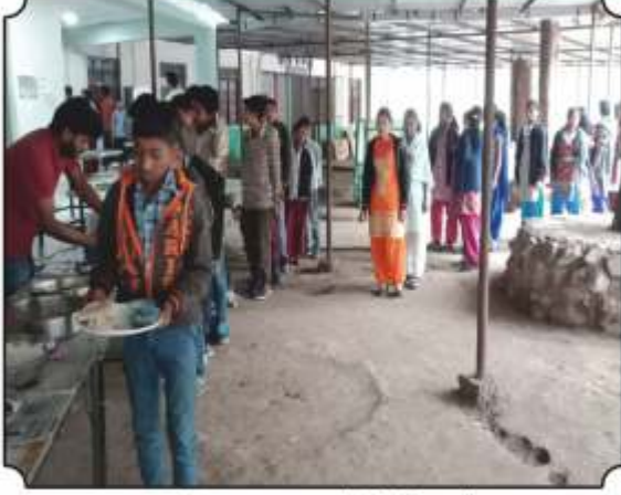
वनभोजनाचा आस्वाद घेतांना विद्यार्थी