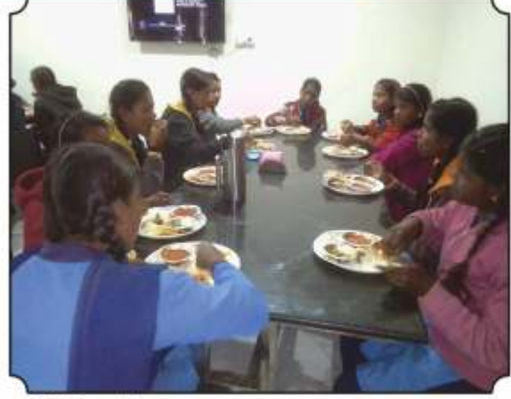
दुपारच्या जेवणाचा आस्वाद घेतांना विद्यार्थी