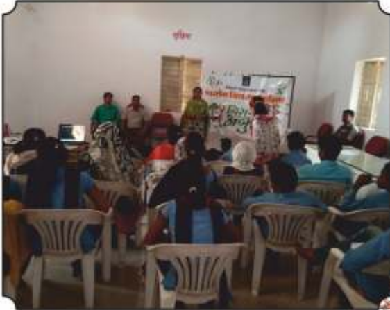
कार्यक्रमांमध्ये उपस्थित विद्यार्थी