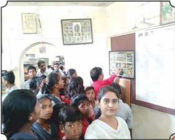
निसर्ग निर्वधन केंद्रावर घेऊन मेळघाटातील विविध पोस्टरसं दाखविण्यात आली