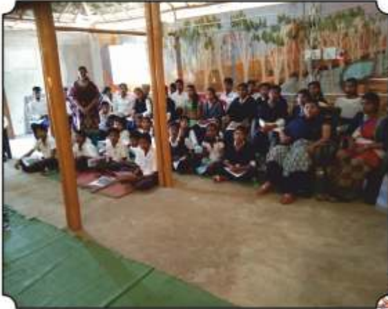
कार्यक्रमांमध्ये उपस्थित विद्यार्थी