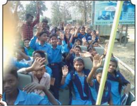
जंगल सफारीची मजा लुटतांना विद्यार्थी