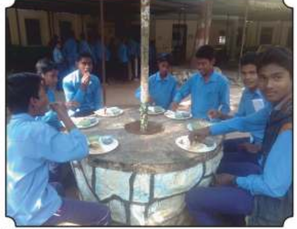
वनभोजनाचा आस्वाद घेतांना विद्यार्थी