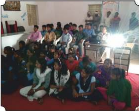
कार्यक्रमांमध्ये उपस्थित विद्यार्थी