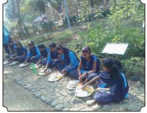
वनभोजनाचा आस्वाद घेतांना विद्यार्थी