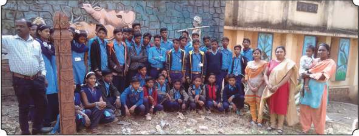
विद्यार्थ्यां समवेत घेतलेले छायाचित्र