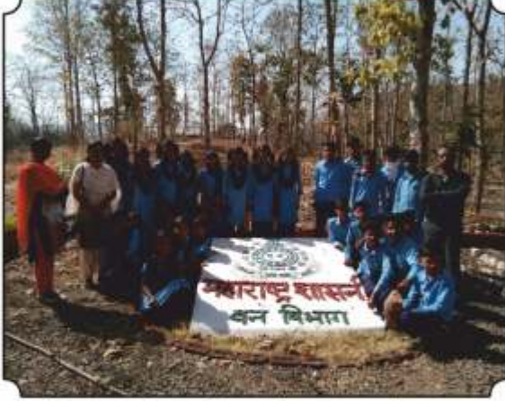
वनसंवर्धनात सहभागाची भावना विद्यार्थ्यांच्या मनात रुजावी म्हणून एक प्रयत्न