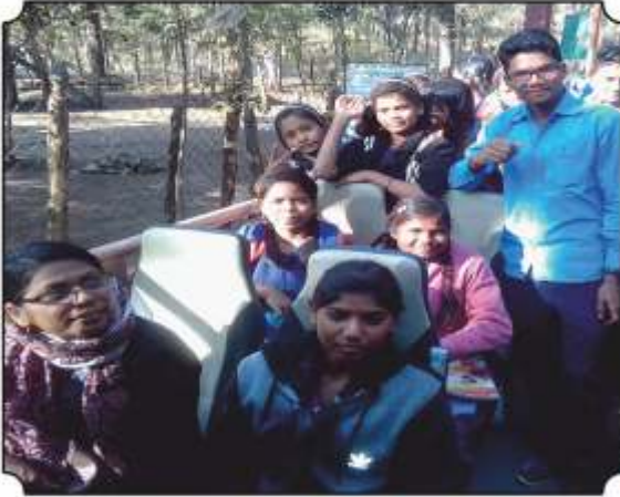
जंगल सफारीचा आनंद लुटतांना विद्यार्थी