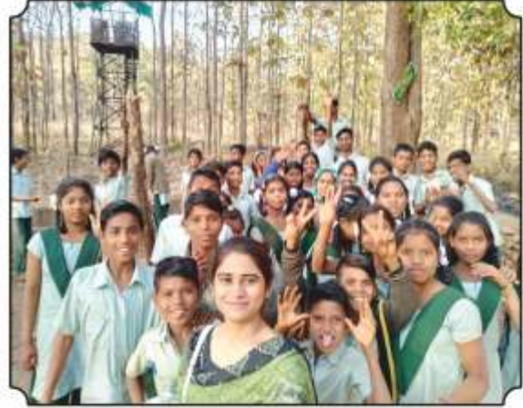
विद्यार्थ्यांना मधान दाखवल्यानंतरचा क्षण