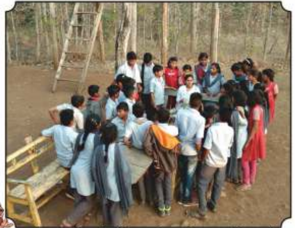
वनसंरक्षण कुटीवर थांबून विद्यार्थ्यांकडून जंगलाला वाघविष्यासाठी विविध युक्त्या विचारताना...