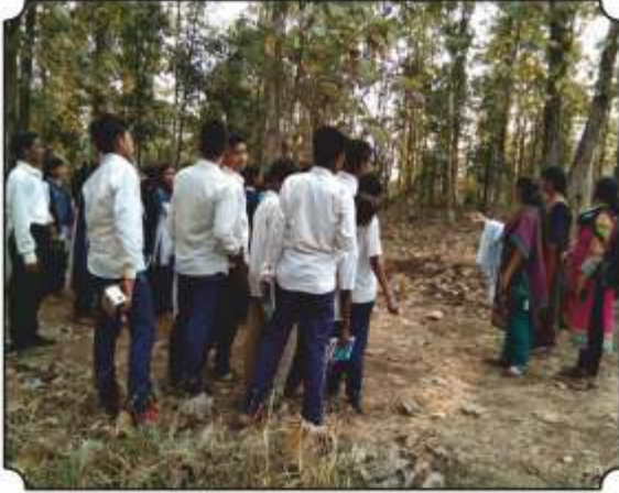
जंगलामधील कॅमेरा ट्रॅप दाखवुन त्याबद्दल माहिती देतांना