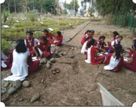
वनभोजनाचा आस्वाद घेतांना विद्यार्थी