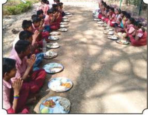
शिस्तबध्द रीताने वनभोजनाचा आस्वाद घेतांना विद्यार्थी