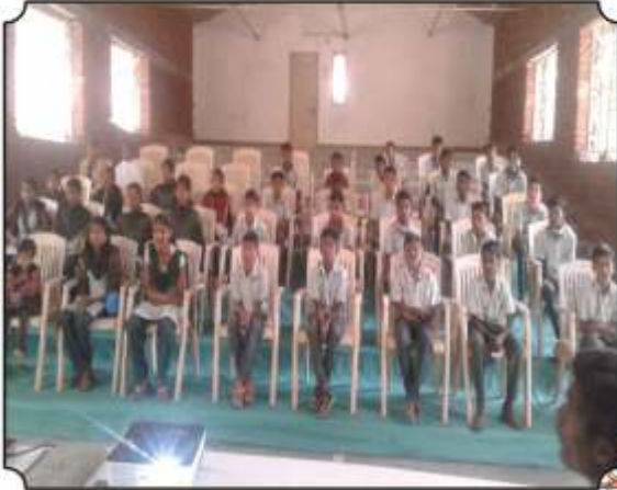
उपस्थित विद्यार्थी संख्या