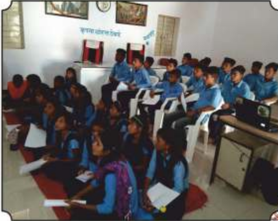
कार्यक्रमांमध्ये उपस्थित विद्यार्थी