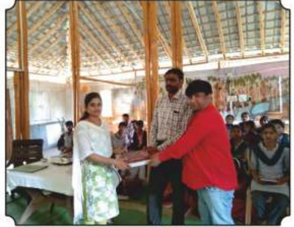
शाळेला पुस्तकांची भेट देतांना