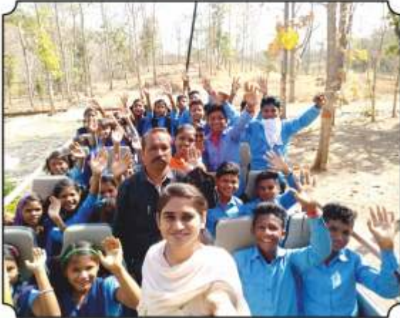
बसमधुन जंगल सफारीला जातांना विद्यार्थ्यांचा आनंद