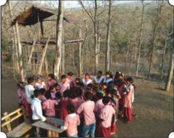
वनसंरक्षण कुटीवर थांबुन विद्यार्थ्यांना प्रश्न विचारून प्रतिक्रिया जाणून घेतांना