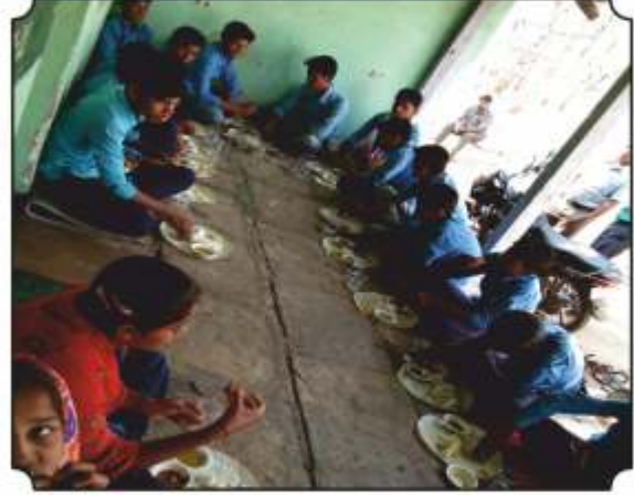
नास्ता व वनभोजनाचा आस्वाद घेतांना विद्यार्थी