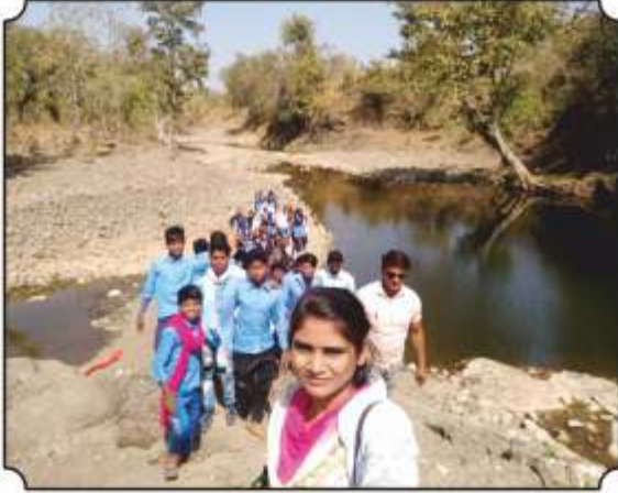
निसर्ग पाऊलवाटेने जातांना नैसर्गिक पाणवठ्यावर धांडून विविध पक्षीची ओळख करून देतांना