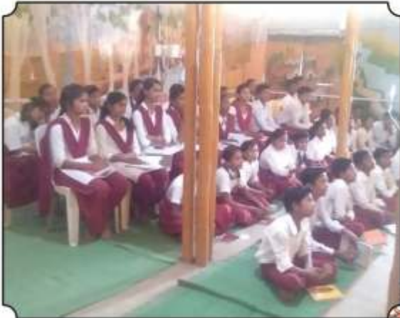
कार्यक्रामाध्ये उपस्थित विद्यार्थी आश्रम शाळा, हरिसाल