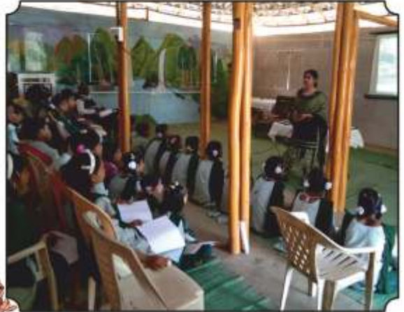
कुला मामाचे विश्व विद्यार्थ्यांना समजावून सांगतांना