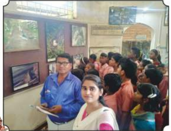
निसर्ग निर्वचन केंद्रावर विद्यार्थ्यांना पोस्टर्स दाखवितांना