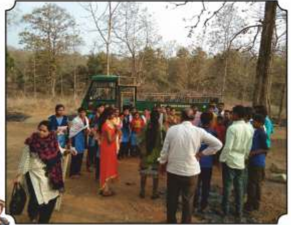
विद्यार्थ्यांना कृत्रिम पाणवठे, कॅमेरा ट्रॅप दाखवितांना