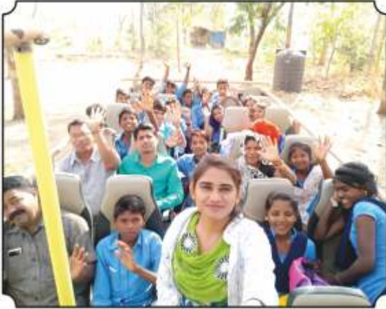
जंगल सफारीची मजा लुटतांना