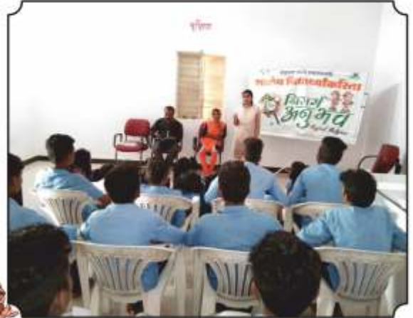
जमिनीची धूप या विषयावर मार्गदर्शन करताना