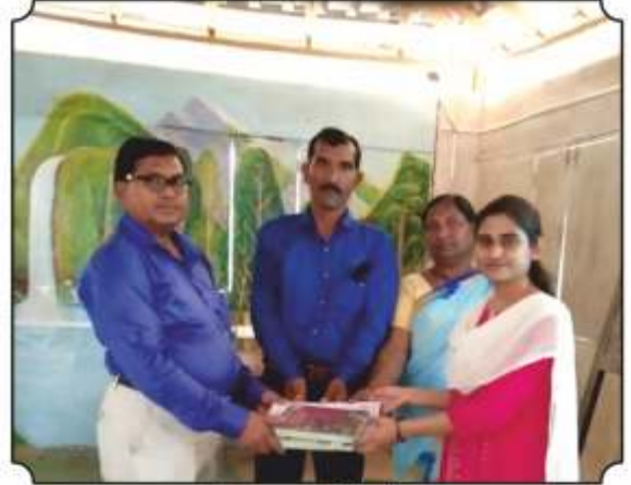
शाळेला पुस्तकांची भेट देतांना