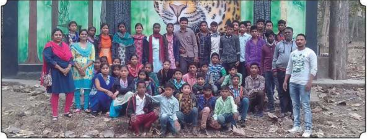
सर्व विद्यार्थ्यां समवेत छायाचित्र