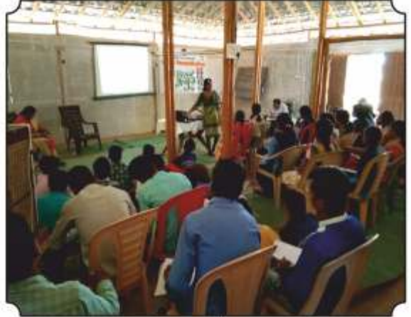
जंगलाला कशा प्रकारे वाघयु शकतो याबद्दल मार्गदर्शन करतांना