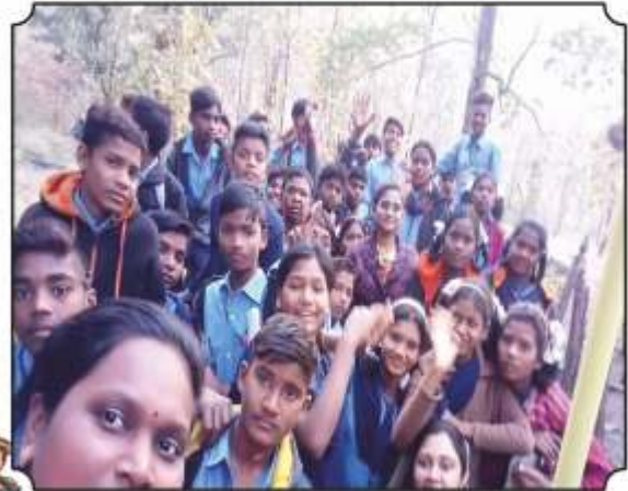
प्राणी दिसल्यानंतर उत्साहित झालेले विद्यार्थी