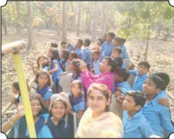
प्राणी दिसल्यानंतर उत्साहाने पाहतांना विद्यार्थी