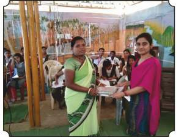
शाळेला पुस्तकांची भेट देतांना