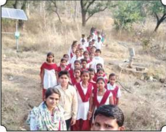
निसर्ग पाऊलवाटेने जातांना प्राण्यांच्या पाऊलखुला दाखवतांना