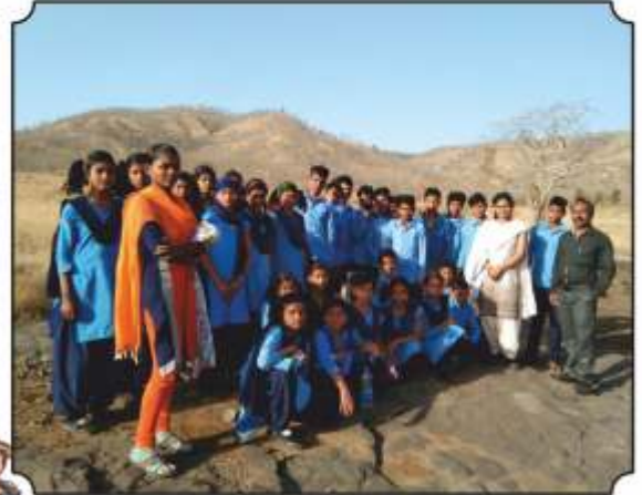
सर्व विद्यार्थ्यांसमवेत छायाचित्र