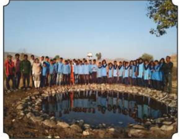
कृत्रिम पाऊलवाट व कॅमेरा ट्रॅप बद्दल माहिती समजुव घेतांना विद्यार्थी