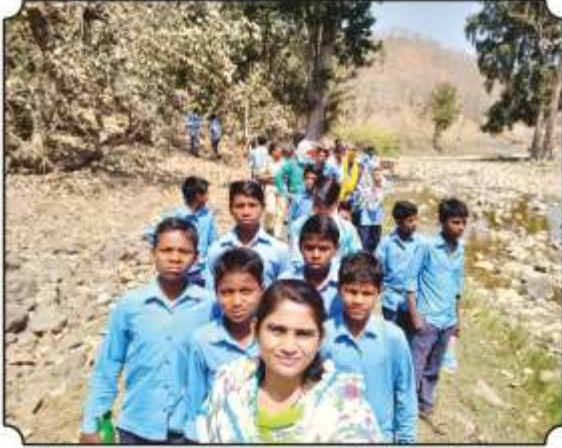
नैसर्गिक पाणवठ्यावर पक्षी आढळले असता ओळख करून देण्यात आली