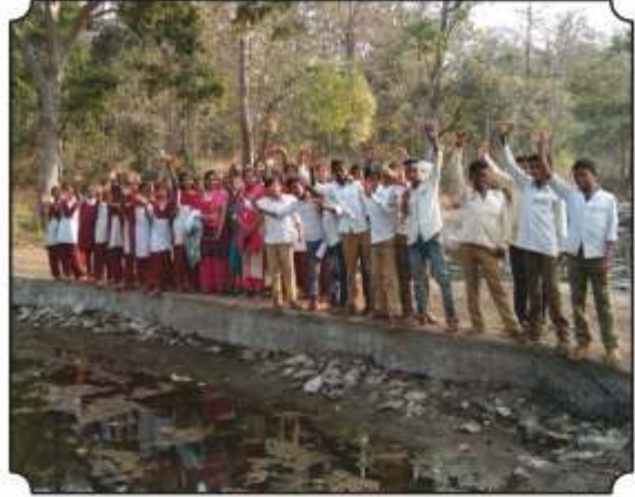
नैसर्गिक पाणवठ्यांवरील विविध पक्षी ओळख करून देण्यात आली