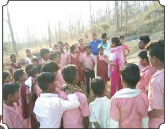
कॅमेरा ट्रॅप, कृत्रिम पाणवठ्यांचे महत्त्व समजावुन सांगतांना