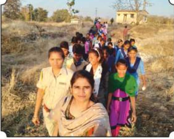
निसर्ग पाऊलवाटेने निघाले असतांना