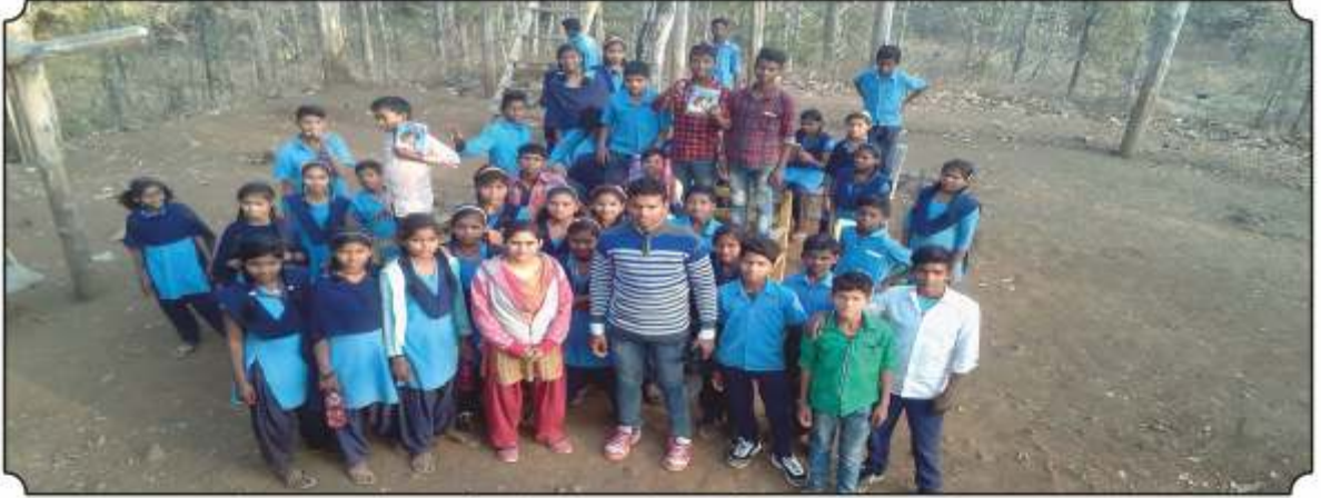
वनसंरक्षक कुटीवर थांबून विद्यार्थ्यांना जंगलांचे महत्व पटवून देण्यात आले