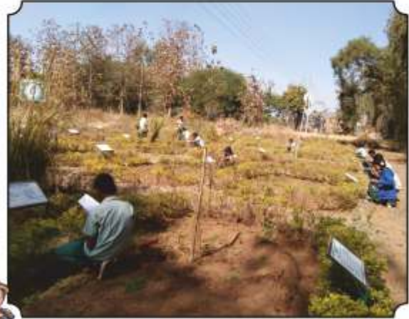
औषधी वनस्पतींची माहिती लिहून घेतांना विद्यार्थी