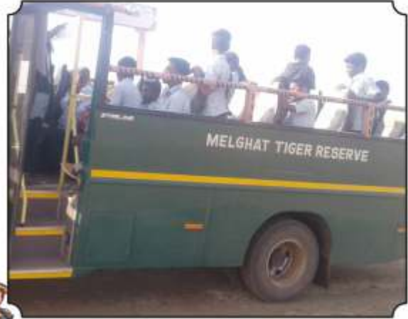
सफारीची मजा लुटतांना विद्यार्थी