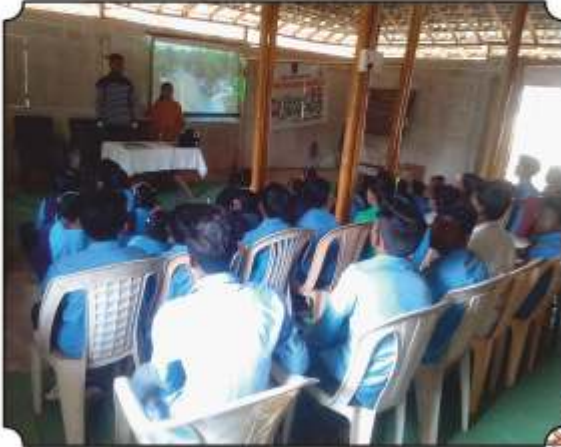
आश्रम शाळेला पुस्तकांची भेट देतांना