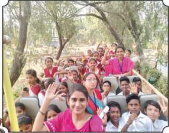
जंगल सफारी बसमधुन परत जाताना आनंदीत विद्यार्थी