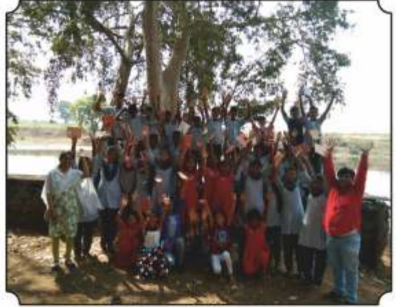
सर्व विद्यार्थ्यांसमवेत छायाचित्र