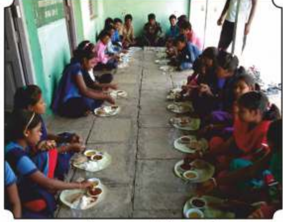
वनभोजनाचा आस्वाद घेतांना विद्यार्थी