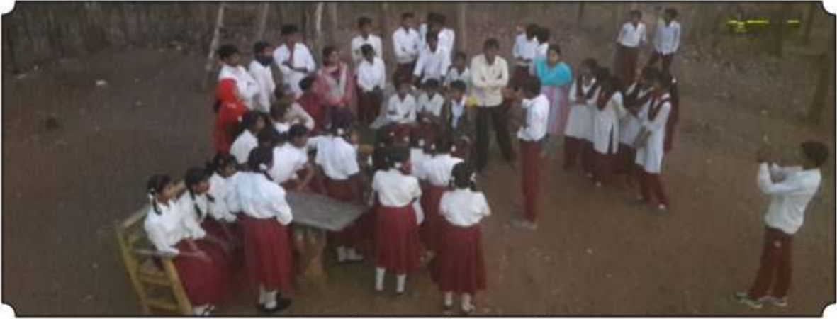
वनसंरक्षक कुटीवर धांबुन जंगलाथे महत्त्व पटवुन देतांना