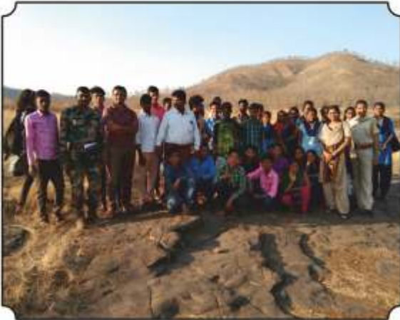
सर्व विद्यार्थ्यांसमवेत छायाचित्र