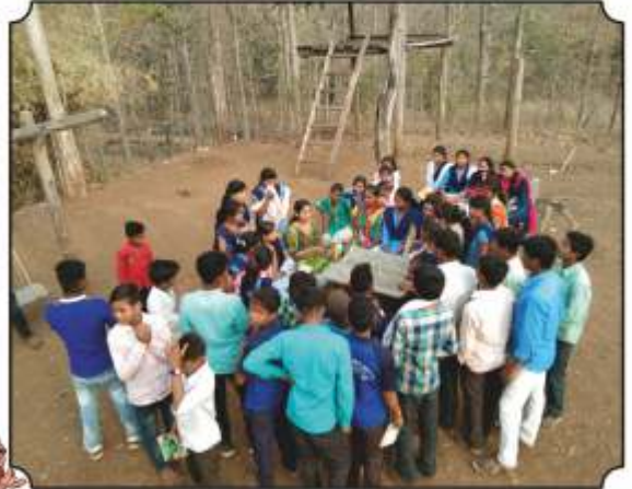
वनसंरक्षक कुटीवर थांबुन विद्यार्थ्यांना शिकविलेल्या सत्रांवर प्रश्न विचारतांना