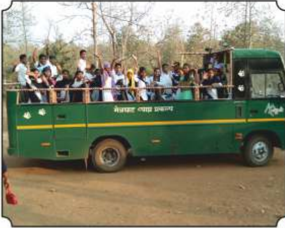
जंगल सफारी बसमधुन सफारीला जातांना उत्साही विद्यार्थी