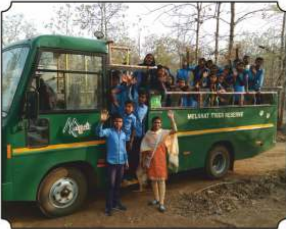
जंगल सफारी बसमधुन परत निघतांनाचा एक क्षण