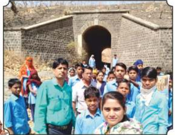
निसर्ग भ्रमंतीला निघाले असतांना