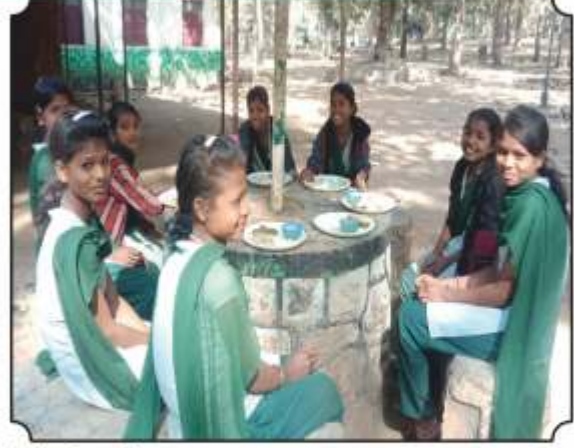
वनभोजनाचा आस्वाद घेतांना विद्यार्थी