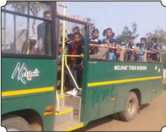
जंगल सफारी बसमधुन सफारीला जातांना