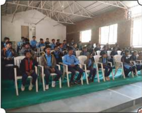
कार्यक्रमांमध्ये उपस्थित विद्यार्थी आश्रम शाळा, जारीदा