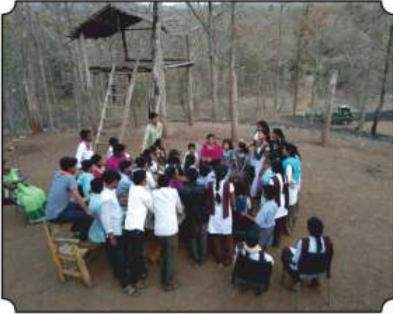
वनसंरक्षक कुटीवर थांबुन विद्यार्थ्यांची चर्चा करतांना