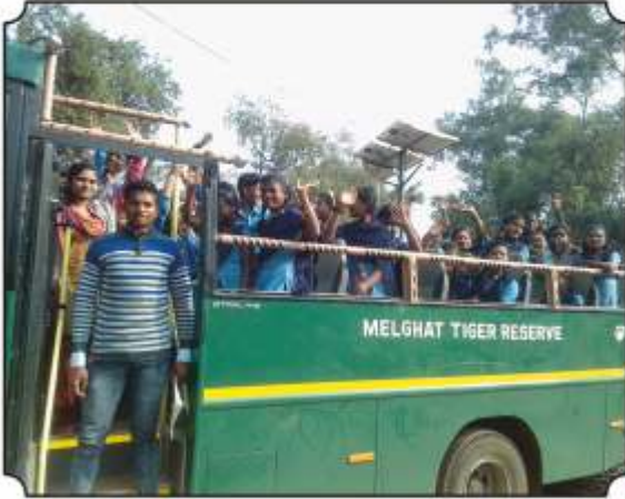
जंगल सफारी निघतांना विद्यार्थी