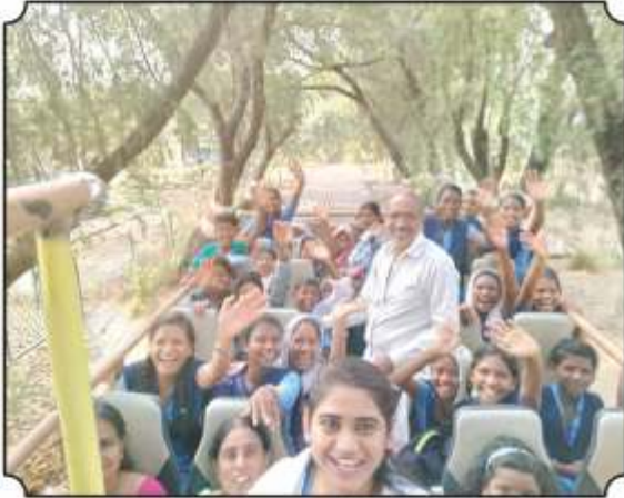
जंगल सफारीला बसमधुन जातांना विद्यार्थ्यांचा आनंद