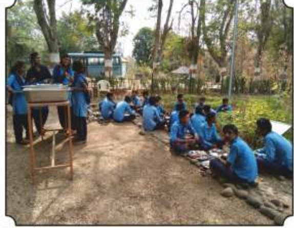
वनभोजनाचा आस्वाद घेतांना विद्यार्थी व विद्यार्थिनी