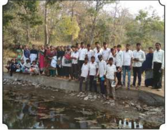
नैसर्गिक पाणवठायार थांबुन