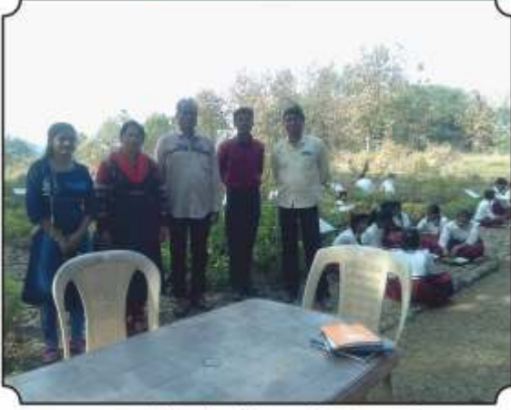
आश्रम शाळेतील सोबत शिक्षक वृंदांसमवेत छायाचित्र