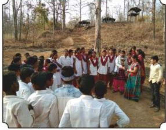
वनसंरक्षक कुटीवर थांबुन त्याबद्दल माहिती देताना