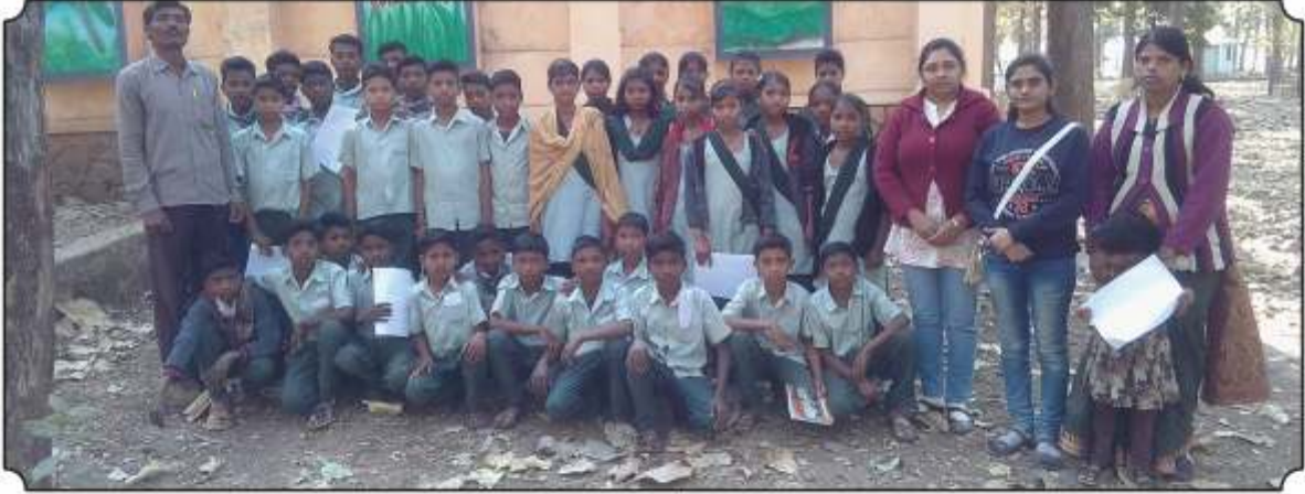
सर्व विद्यार्थ्यां समवेत छायाचित्र