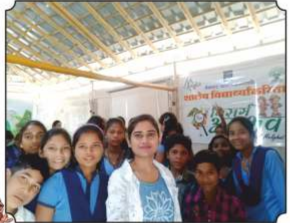
विद्यार्थ्यांसोबत घेतलेली सेल्फी