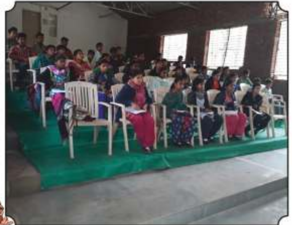
कार्यक्रमांमध्ये उपस्थित विद्यार्थी