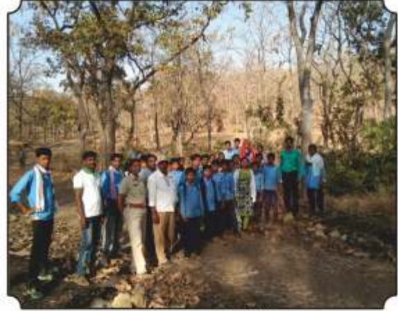
कॅमेरा ट्रेप दाखवून माहिती देतांना