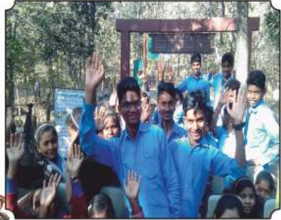
जंगल सफारी गेट मधुन बाहेर पडतांना विद्यार्थी