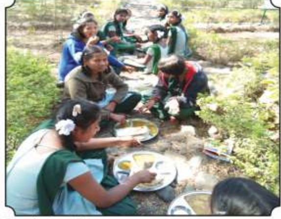
वनभोजनाचा आस्वाद घेतांना विद्यार्थी व विद्यार्थिनी