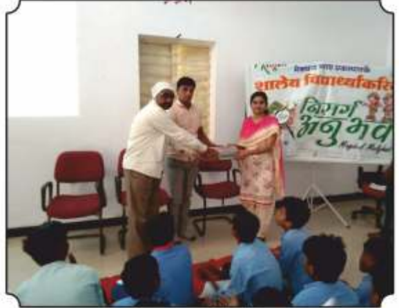
शाळेला पुस्तकांची भेट देताना