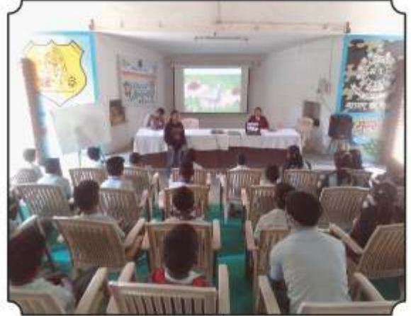
जादुई मेळघाटची ओळख देतांना