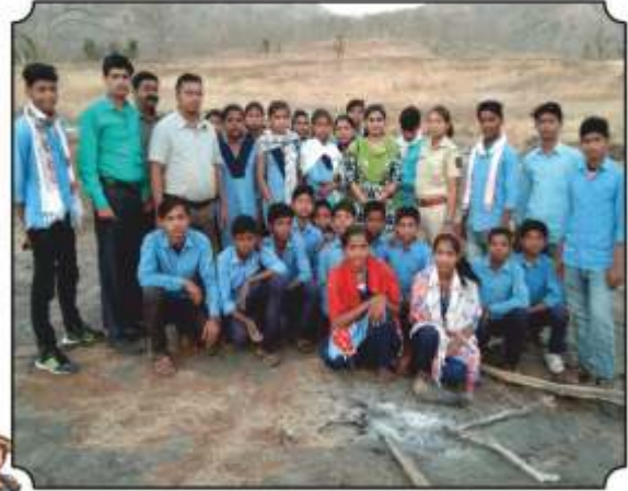
सर्व विद्यार्थ्यांसमवेत छायाचित्र