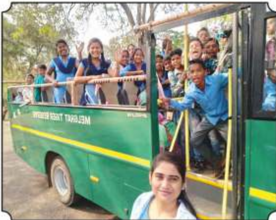
जंगल सफारीची मजा लुटतांना विद्यार्थी