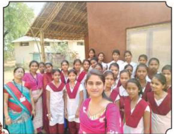
सर्व विद्यार्थ्यांसमवेत घेतलेले छायाचित्र