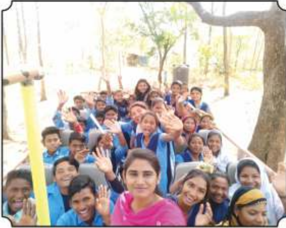
जंगल सफारी बसमधुन जातांना विद्यार्थ्यांचा उत्साह