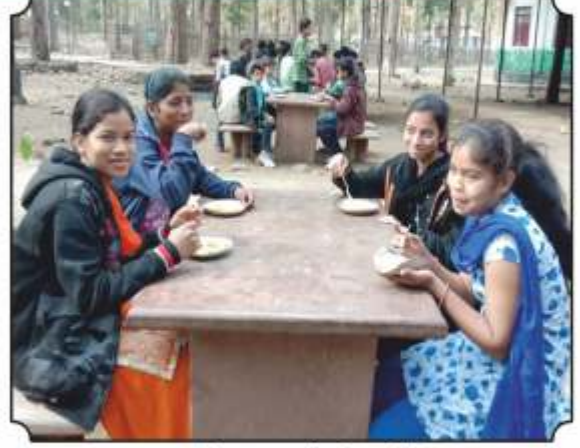
सकाळी नास्ता करतांना विद्यार्थीनी