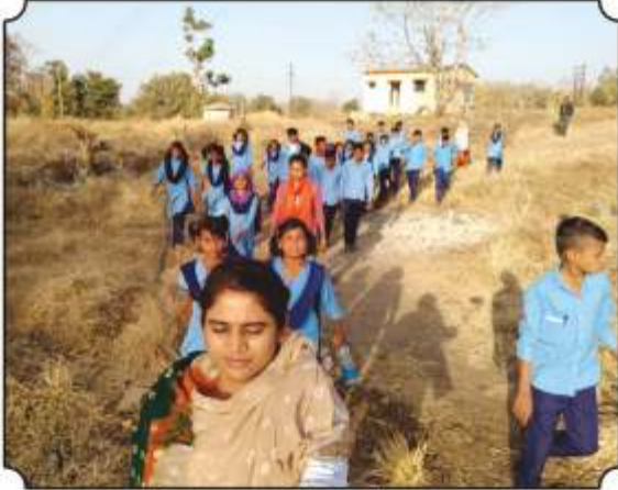
निसर्ग पाऊलवाटेने निघाले असता...