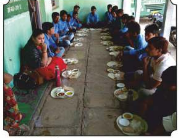
नारस्ता तसेच वनभोजनाचा आस्वाद घेतांना विद्यार्थी