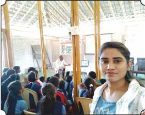
व्हिडिओ पाहतांना विद्यार्थी