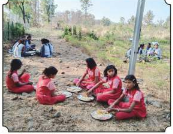
वनभोजनाचा आस्वाद घेतांना विद्यार्थी व विद्यार्थिनी