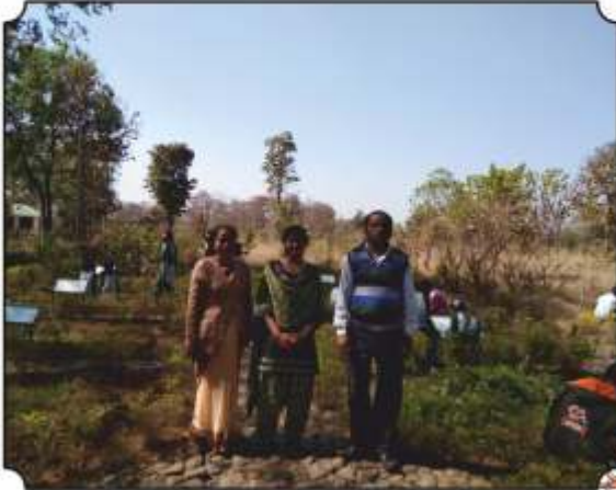
शिक्षकांसमवेत बॉटनिकल गार्डनमध्ये घेतलेले छायाचित्र