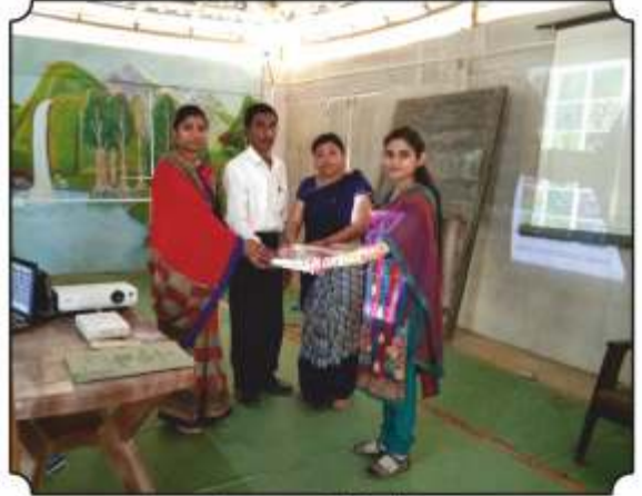
शाळेला पुस्तकांची भेट देतांना