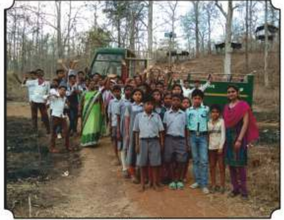
निसर्ग पाऊलवाटेने निघाले असता एक क्षण