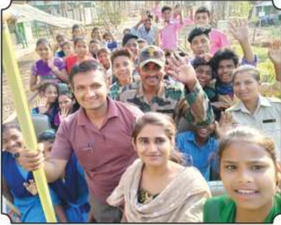
बसमधुन जंगल सफारीला जात असतांना