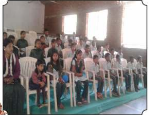
लक्षपूर्वक ऐकतांना विद्यार्थी