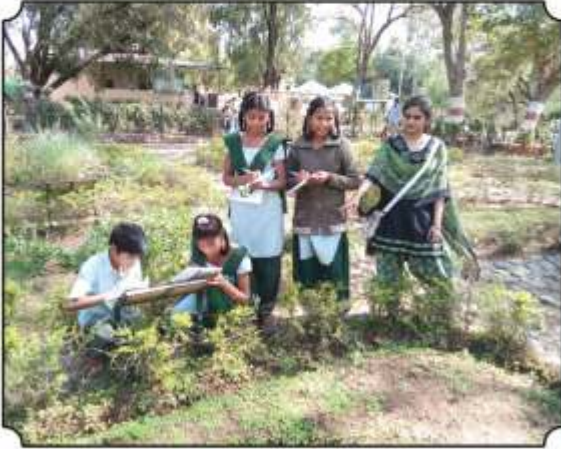
मेळघाटातील औषधी वनस्पतींची ओळख करून देतांना