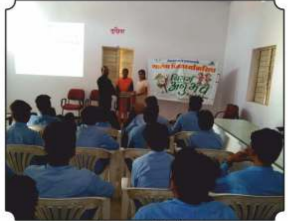
शाळेला पुस्तकांची भेट देताना