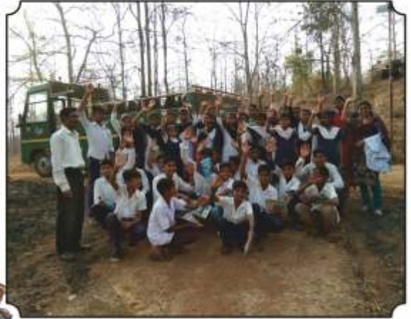
निसर्ग भ्रमंती संपल्यानंतरचा एक क्षण