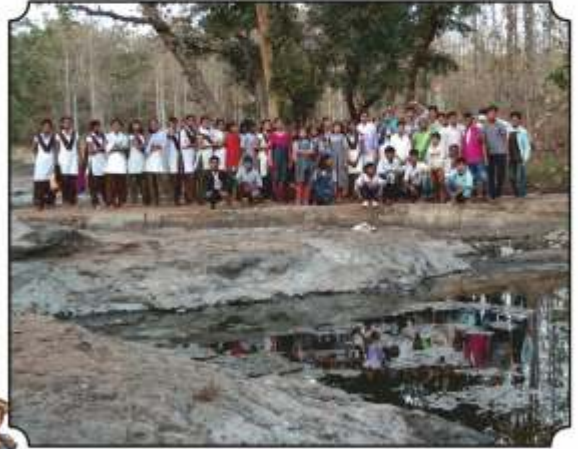
नैसर्गिक पाणवठ्यावरी पक्षी दाखविल्यानंतरचा एक क्षण