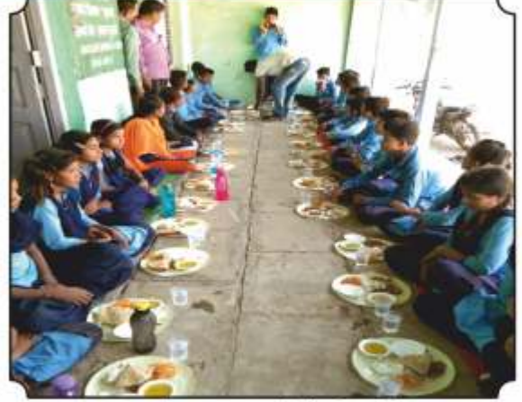
वनभोजनाचा आस्वाद घेतांना विद्यार्थी