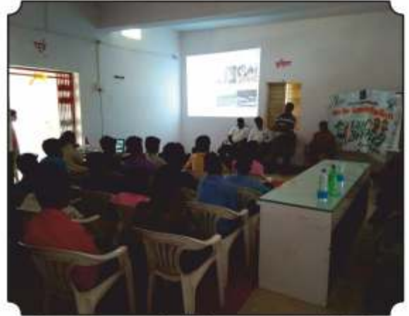
जंगलाला आग लागल्यामुळे होणारे नुकसान याबद्दल माहिती देतांना