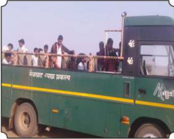
जंगल सफारी बसमधुन निघतांना