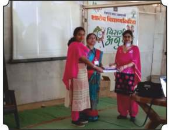
शाळेला पुस्तकांची भेट देतांना