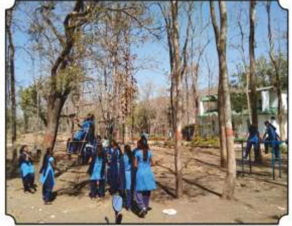
वनसंकुलमध्ये खेळण्याची मजा लुटतांना विद्यार्थी